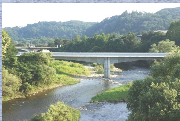
土木学会賞（田中賞）を受賞した地下鉄東西線の広瀬川橋梁（仲ノ瀬橋からの眺望）